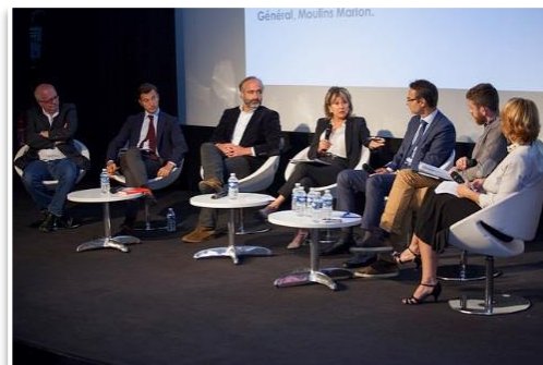
Première table-ronde : « De la prise de conscience aux premières actions »

→ Plus d'informations : Communiqué de presse / Site internet du Club PME Climat / Vidéos et Photos