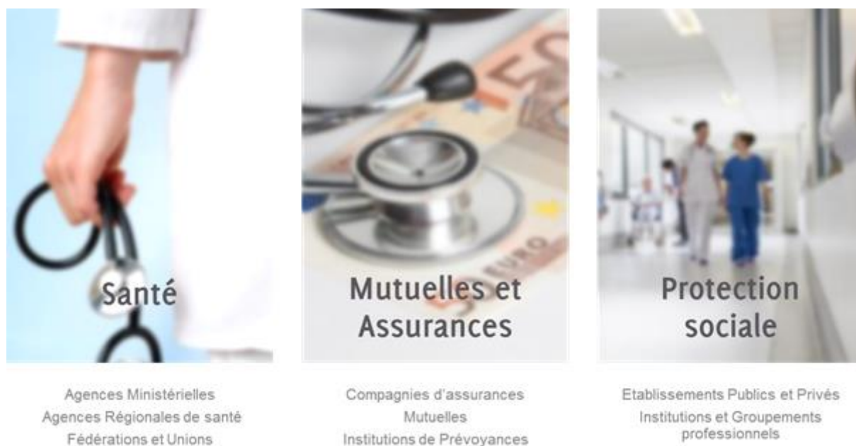
Figure 1 : Offre proposée par Doshas Consulting

Les secteurs prioritaires adressés en termes de cible sont présentés à la figure ci-dessous :