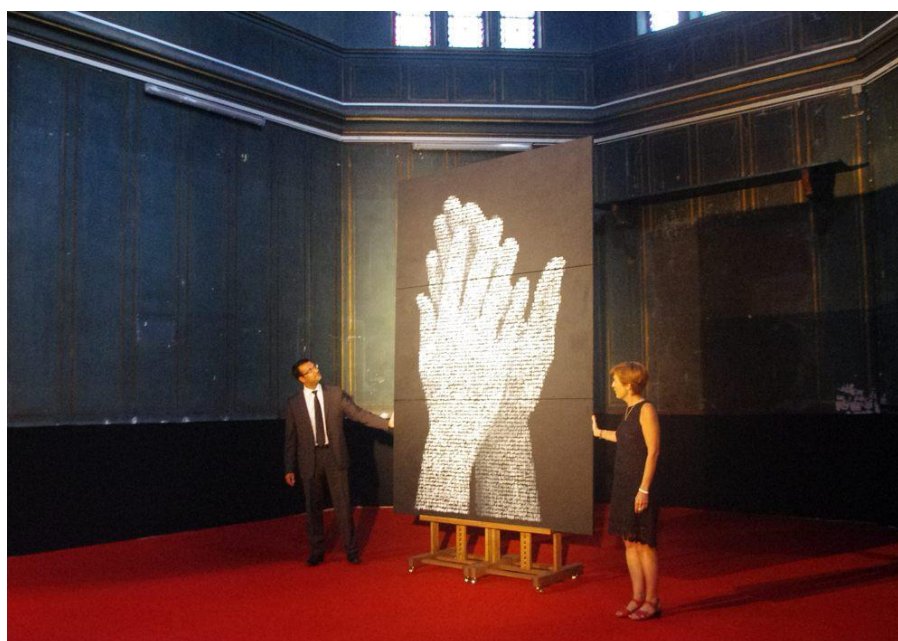
Figure 4 : Triptyque réalisé par l'artiste Olivier TERRAL

Cette exposition est le fruit de 4 ans de travail bénévole auprès de soignés et de soignants dont Didier AMBROISE, par l'intermédiaire de son cabinet Doshas Consulting, soutient avec force l'action positive de l'artiste Olivier TERRAL.